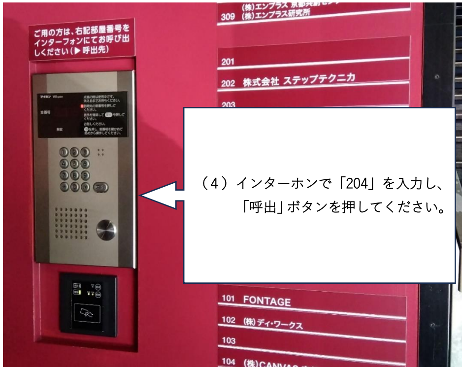
(4) インターホンで「204」を入力し、 「呼出」ボタンを押してください。