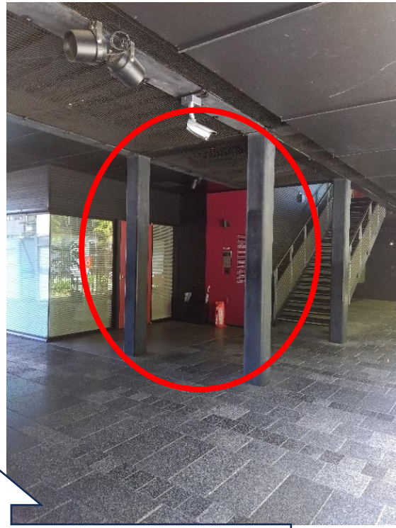
(3) 渡った後、左手に8号館への入り口が見えます。 中へ入るとインターホンがございます。