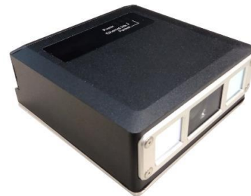
※図 2：対象となるビジョンヘッド YCAM3D-17M-KRC-rev2/ YCAM3D-10M-KRC-rev2/ YCAM3D-10L-KRC-rev2/ YCAM3D-6-KRC-rev2