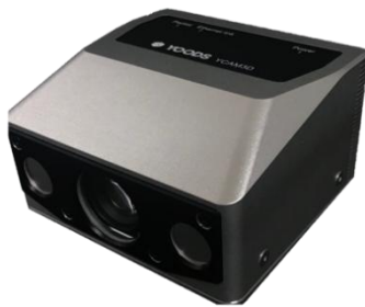
※図 1：対象となるビジョンヘッド YCAM3D-10L-KRC-rev1