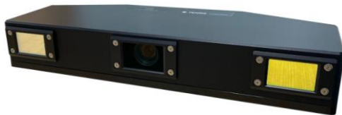
※図 3：対象となるビジョンヘッド YCAM3DM-6-KRC